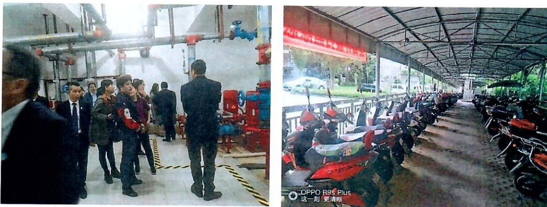
（上图：在海棠花语项目参观学习现场图片）

绍了小区概况，包括小区占地面积、交房时间、住户情况、物业费收缴情况等。该项目的摩托车、电瓶车专区管理，规范、安全、有序，引得同行纷纷拍照、观摩学习。