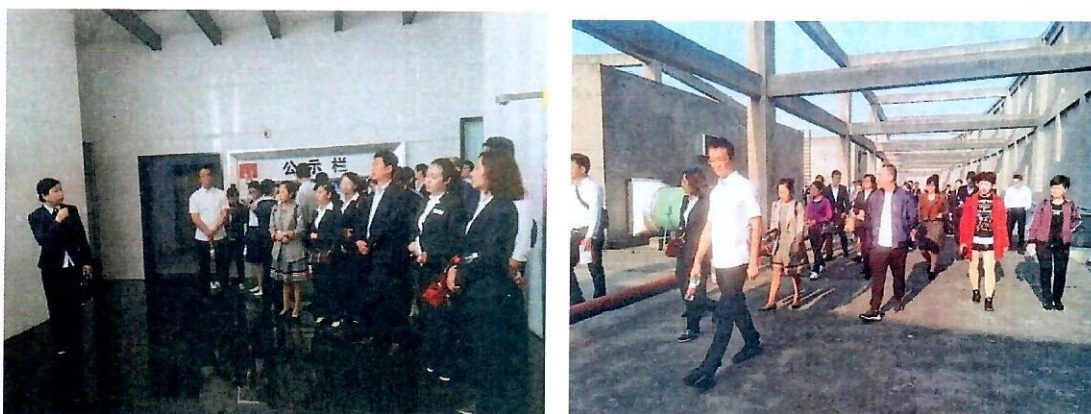
（上图：在金海大厦项目参观学习现场图片）

11月15日，参观学习小组来到了本次交流学习的最后一站——东区的金海大厦项目和恒大城项目。首先，大家参观了衡易物业公司在管的金海大厦项目，在项目负责人的引领下，大家对该项目的公示栏、电梯机房、消防泵房、监控控制中心、档案管理进行了现场观摩学习。