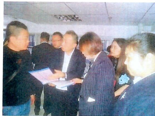
（上图：在上城项目参观学习现场图片）

11月14日上午，参观学习小组来到米易县，参观了合美家物业公司在管的海棠花语项目。海棠花语工作人员向大家详细介绍